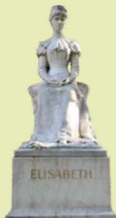
Kaiserin Elisabeth „Sissi“