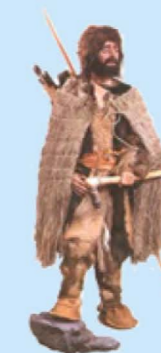
Ötzi, der Mann aus dem Eis

Von den Weinbergen am Eingang zum Schnalstal bis zur glitzernden Gletscherwelt der Öztaler Alpen lässt ein breites Wanderwegenetz (über 150 km) jene Pfade erahnen, auf denen vor 5.300 Jahren der Mann aus dem Eis unterwegs war. Die Geheimnisse rund um Ötzis Lebenswelt lüftet das Aktivmuseum ArcheoParc. Die atemberaubende Kulisse des Naturparks Texelgruppe mit ihrer Vielfalt an Bergblumen, Gämsen und Murmeltieren eröffnet Sport- und Naturfreunden unzählige Möglichkeiten.