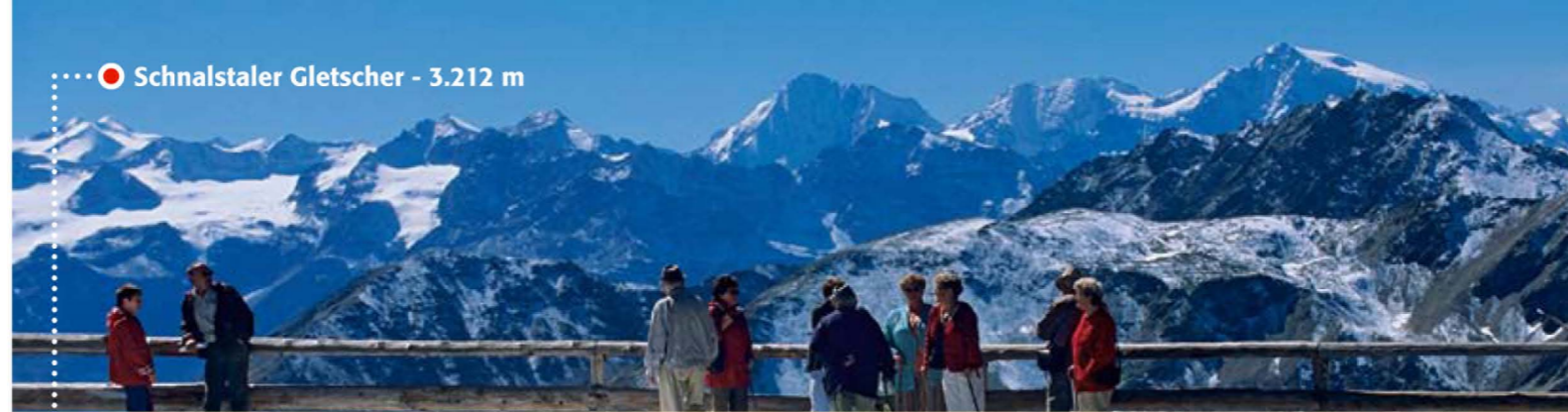
● Schnalstaler Gletscher - 3.212 m

Die Seilbahn mit der höchsten Bergstation Südtirols führt hinauf in hochalpine Erlebniswelten, die umgeben sind von funkelndem, ewigem Eis. Auf einer Meereshöhe von 3.212 m gewährt eine sonnige Panoramaterasse eine traumhafte Aussicht auf das Reich der Gletscher mit zahllosen 3000ern. Direkt an der Bergstation ist einiges über Ötzi, den Mann aus dem Eis, zu erfahren, der ganz in der Nähe, am Tisenjoch, gefunden wurde. Hierzu lohnt auch ein Blick in die Ötzi-Show-Gallery oder ein Besuch der Ausstellung zu den Gletscherwelten. Die Gletscher hautnah erfahrbar macht der „Ötzi-Express“ – eine Expedition per Pistenraupe, bei der (mit ein wenig Glück) eine Eishöhle besucht werden kann.