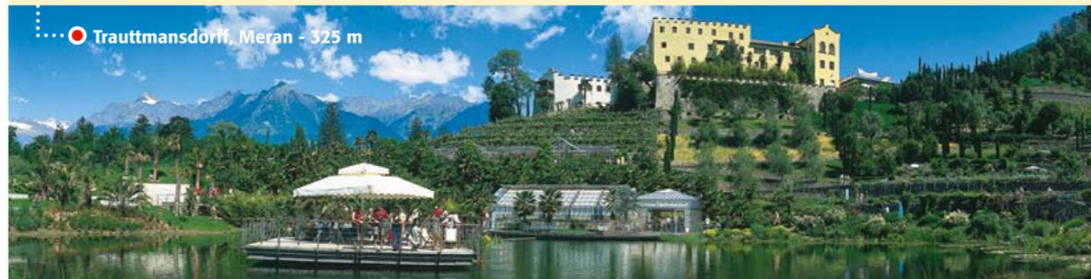
● Trauttmansdorff, Meran - 325 m

Preise und Gültigkeit des Tickets bis auf Widerruf.