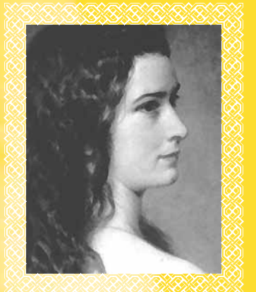
Kaiserin Elisabeth (1837 - 1898)

Auf Spurensuche zwischen den Gärten von Schloss Trauttmansdorff und dem Herzen der Kurstadt Meran